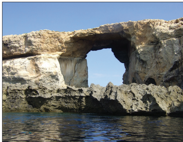
Belle vue depuis la mise à l'eau de Blue Hole

Billinghurst Cave est une grotte assez impressionnante. L'entrée commence à 10 mètres de profondeur et le fond est à -27 mètres. Le tunnel qui suit est de 10 mètres de haut et de 25 mètres de large. Un fil d'Ariane permet de faire le tour de ce gros tunnel. Au fond, il est même possible de faire surface. Il faut cependant ne pas retirer son détendeur, la qualité de l'air pouvant être incertaine. Depuis le fond du tunnel, si on éteint toutes les lampes, on distingue la lueur de la sortie, 200 mètres plus loin.