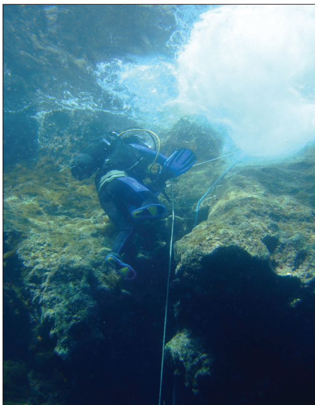
Sortie de l'eau, on enlève les palmes et on monte à la corde

de diamètre dans la roche, pas très loin de la mer. Vers 5 mètres de profondeur, une belle arche mène aux falaises et à la profondeur. En face de cette arche, une grotte d'une cinquantaine de mètres entre sous l'île de Gozo. Cette plongée, comme beaucoup des plongées de cette île, est exceptionnelle par ses découpes calcaires.