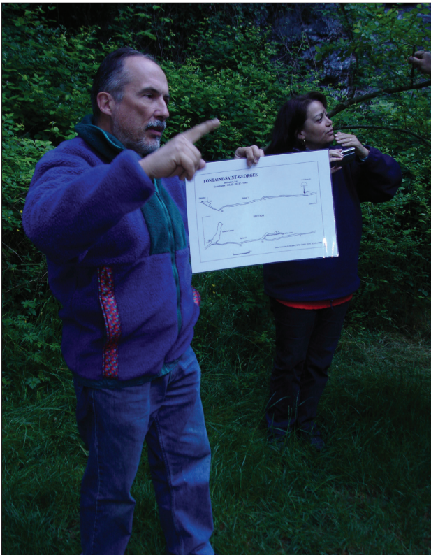
Description de grotte par Beat Müller

vastes et nombreuses. Dans ces régions, des plongées peuvent se faire en passant d'une entrée à l'autre sans jamais changer de zone. C'est-à-dire qu'une plongée se déroule toujours dans la lumière directe de l'entrée de la grotte, à moins de 20 mètres de profondeur et pas à plus de 50 mètres de l'entrée. Ce brevet peut aussi trouver de l'intérêt à Gozo (Malte) où les cavités ne vont pas très loin. Cette destination constituerait une bonne destination de formation. Ce niveau n'a pas vraiment d'intérêt en Suisse ou en France, car les grottes offrant une vaste zone 1 sont très rares. Nous pouvons néanmoins citer