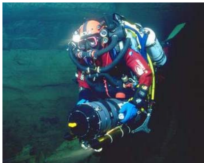
CMAS-konform ausgerüsteter Scooter-Taucher mit Helm

tert und sich beim Zusammenstoß mit einer Felsnase einen Schädelbruch holt, wird sich mit hoher Wahrscheinlichkeit (wenn er den Unfall überlebt und nicht ertrinkt) mit einer Kürzung der Versicherungsleistungen konfrontiert sehen, analog dem nicht angegurteten Autofahrer oder einem Mofalenker ohne Helm