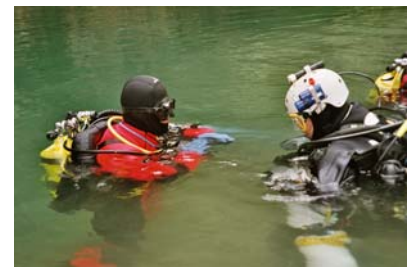
2 Taucher beim Partner-Check